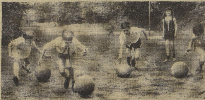
«Мячи». Барбара Ильзе. (ГДР).